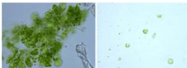
荷花叶片原生质体